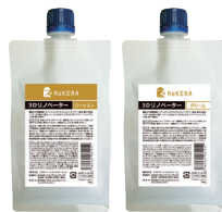
リケラ3Dリノベーター